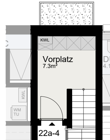
Wohnungseingang im 1. Obergeschoss